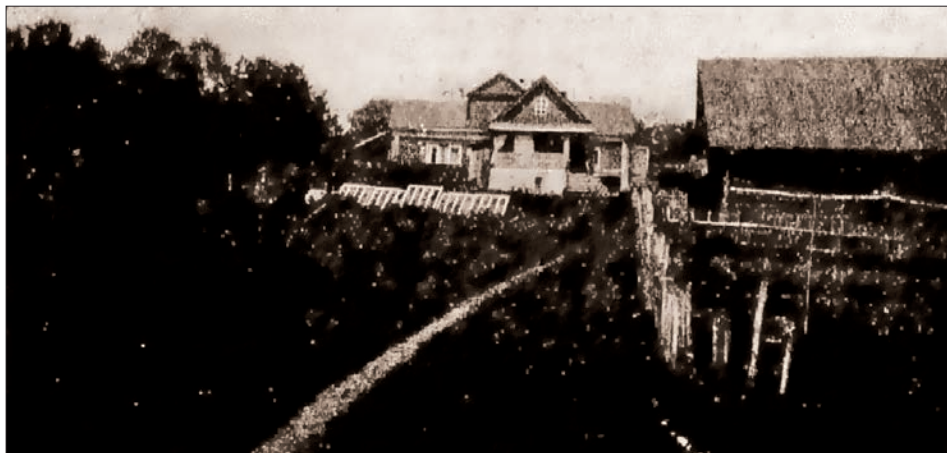
Усадьба в Дулебино. Фотография из издания «По Тульскому краю: (пособие для экскурсий)», 1925 год

по всей видимости, не было, поскольку Гаевский писал, что «в церкви был только я и Полонский». Далее он пишет, что из церкви все вчетвером отправились обедать, захватив по дороге Тургенева с его адъютантом Топоровым. О второй супруге же Григоровича Гаевский отзывается как о «очень простой и доброй венке без малейших претензий» и отмечает, что «супруги были очень взволнованы и растроганы и неоднократно плакали. Видно, что они очень довольны друг другом, и я рад, что бедный Григорович, хоть на старости лет, поживет спокойно» 33 .