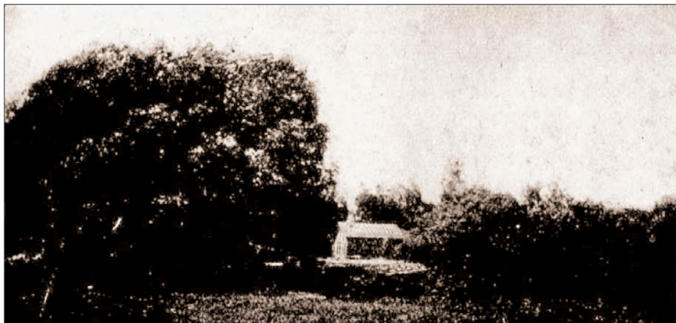
Мельница в Дулебино. Фотография из издания «По Тульскому краю: (пособие для экскурсий)», 1925 год