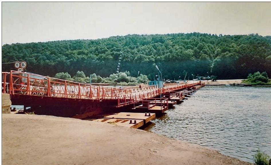
Ока в районе города Озёры и села Клишино

в его же автобиографии 3 . Скончался же он в Санкт-Петербурге 22 декабря 1899 года от кровоизлияния в мозг. Перед этим Григорович долго болел: в 1887 году у него случился удар 4 . Писателя отпевали его в церкви Вознесения в Адмиралтейских слободах, указав в метрической записи возраст усопшего как 79 лет 5 , что соответствует 1820 году рождения. Данный факт, впрочем, не отменяет неточностей в возрасте, нередко допускаемых при оформлении подобных документов, поэтому данную информацию следует принимать лишь как косвенную. Для того, чтобы удостовериться в ненадёжности данного источника, достаточно лишь посмотреть запись в метрической книге о втором браке Григоровича — и тогда выходит, что он родился вообще в 1823 году, потому что на момент брака (май 1881 года) ему было 58 полных лет. Автором данной статьи при проверке метрических книг села Никольское-на-Черемшане с 1820 по 1823 годы не обнаружена запись о рождении будущего писателя. Из всей этой проблемы можно сделать несколько выводов: либо Дмитрия Васильевича крестили в другом храме, либо метрика о рождении, возможно, не сохранилась, либо он родился в другой год — а это уже к вопросу о юбилее.