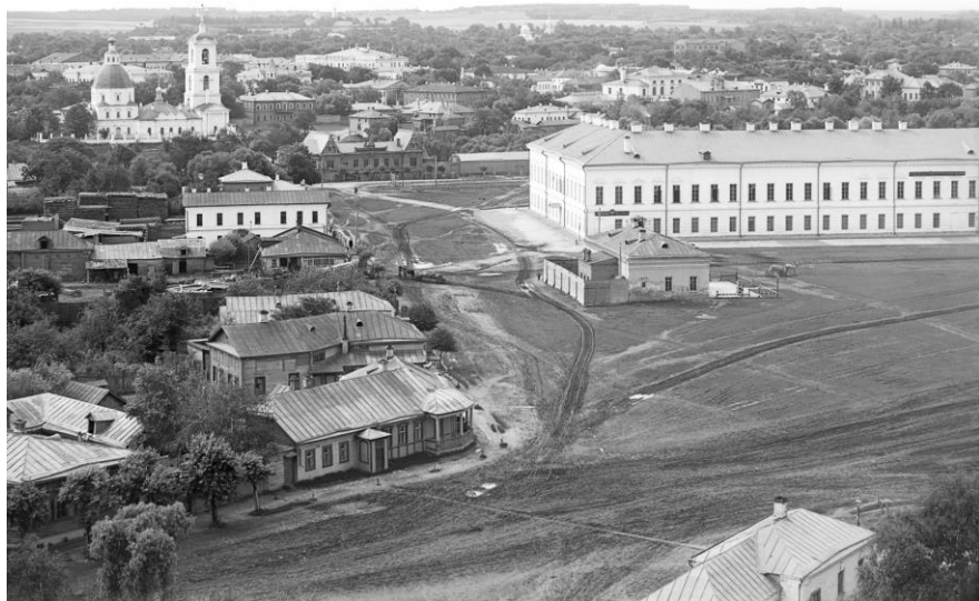
С. М. Прокудин-Горский. Рязань. Общий вид с севера. 1912 г.