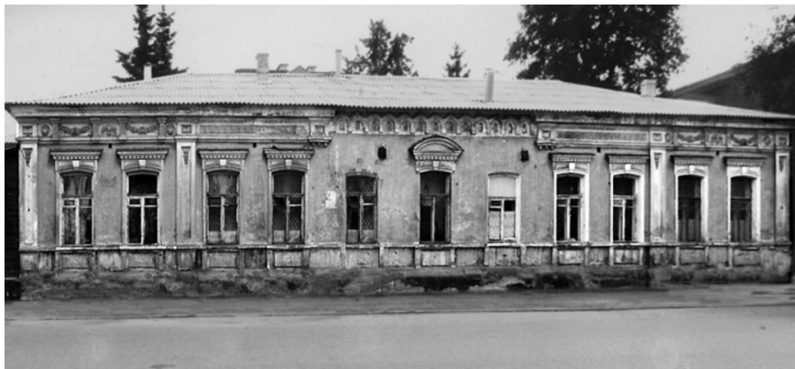
Дом Денисовых. Рязань, Николодворянская улица, 17. Фотография 2006 г.