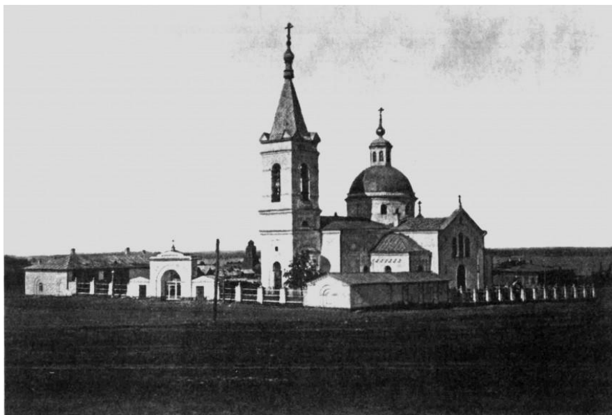
Хвалынский. Собор Казанской иконы Божией Матери до перестройки. 1890—1899 год.